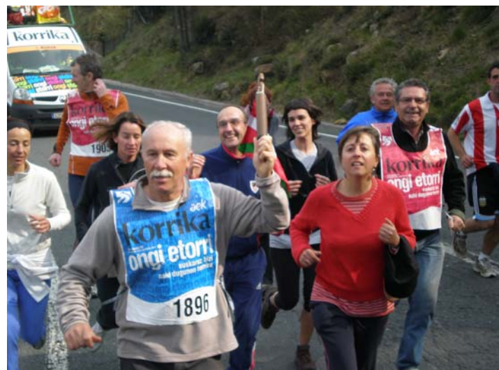
Fruiztarrak Korrika 16an